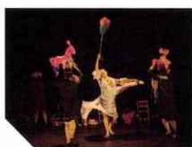
144 MISERICORDIA Emma Dante