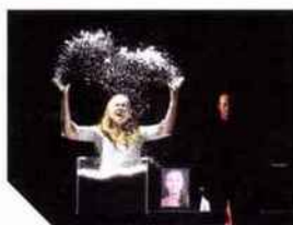
141 ANTIGONE À MOLENBEEK & TIRESIAS Guy Cassiers