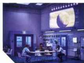
146 FRATERNITÉ, CONTE FANTASTIQUE Caroline Guiela Nguyen