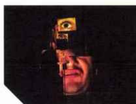
151 Y ALLER VOIR DE PLUS PRÈS Maguy Marin