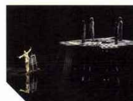
152 LA TRILOGIE DES CONTES IMMORAUX (POUR EUROPE) Phia Ménard