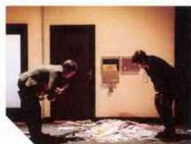
138 AUCUNE IDÉE Christoph Marthaler

PAS DU TOUT UN PEU BEAUCOUP PASSIONNÉMENT À LA FOLIE