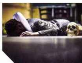
148 HAMLET À L'IMPÉRATIF! Olivier Py